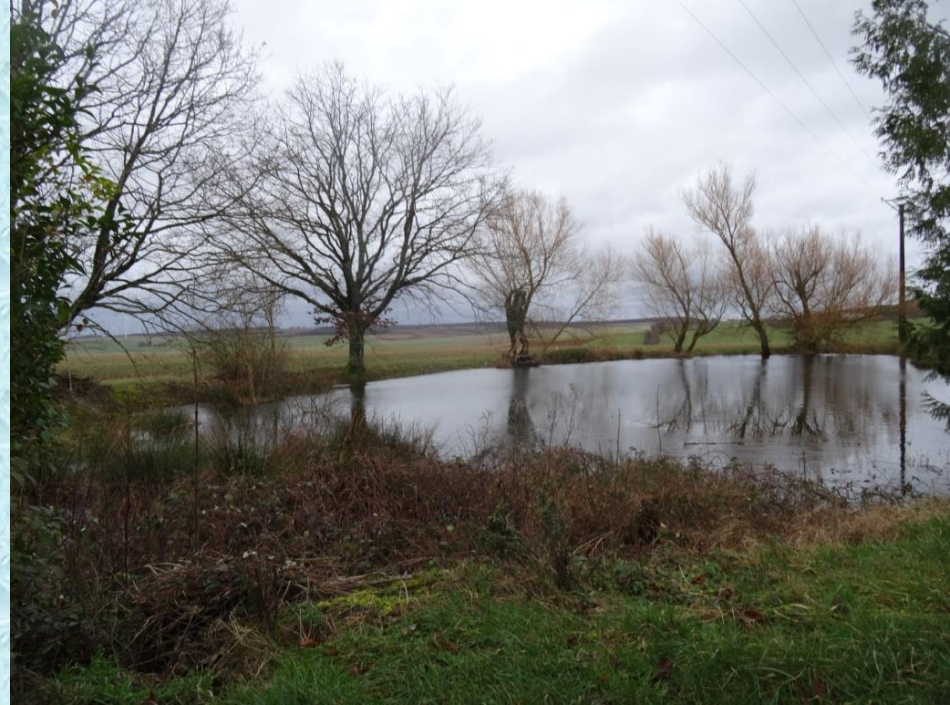
Arrivée à la ferme du Petit Crosley