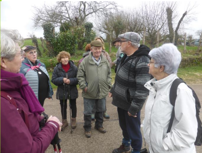
Lavoir de Cuchot à 50m