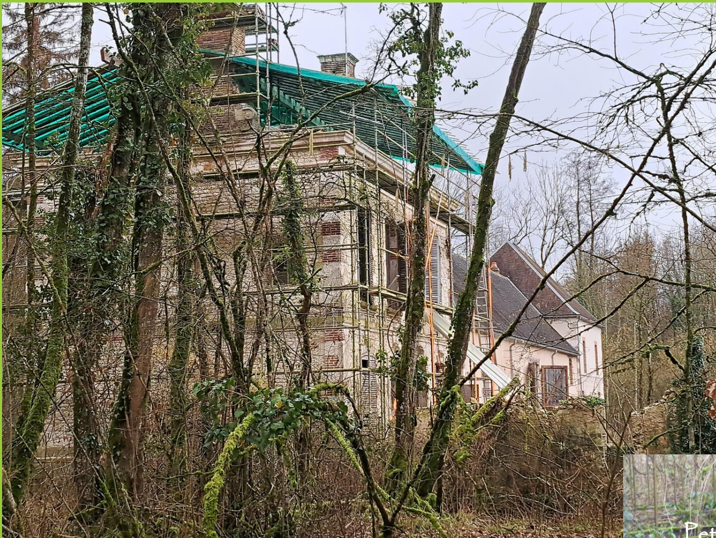
Château en travaux