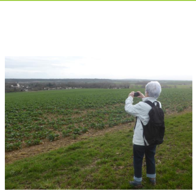
Vue sur l'église de Venizy