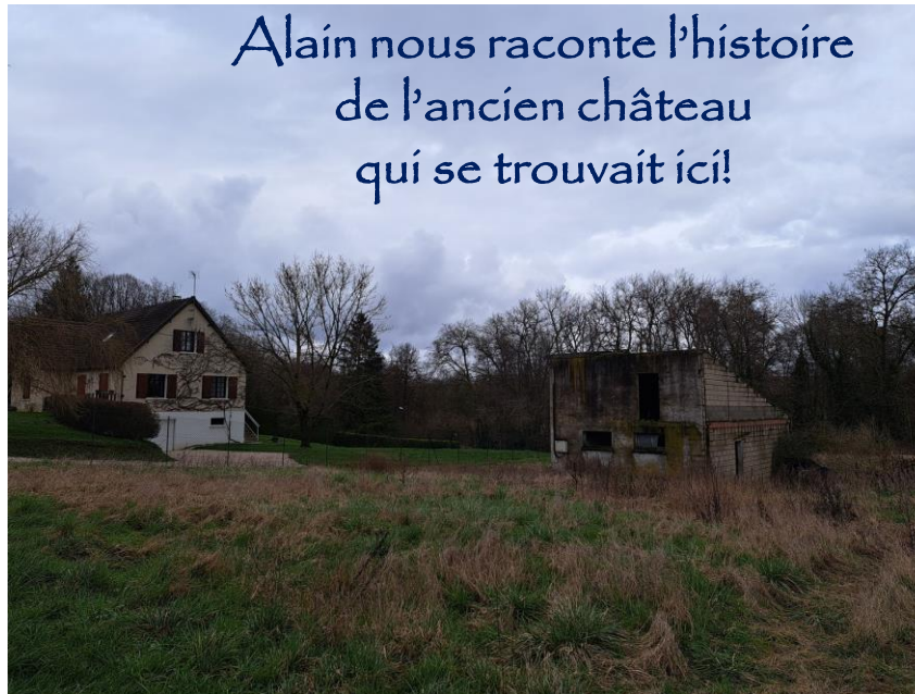
Alain nous raconte l'histoire de l'ancien château qui se trouvait ici!