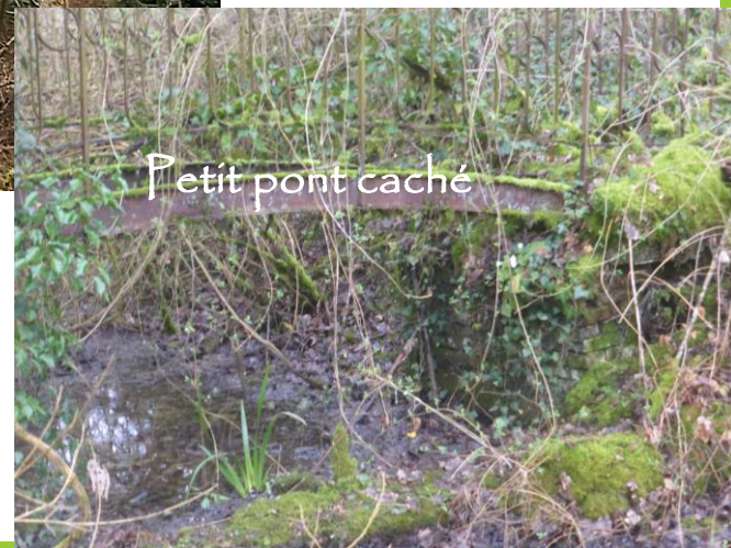
Petit pont caché