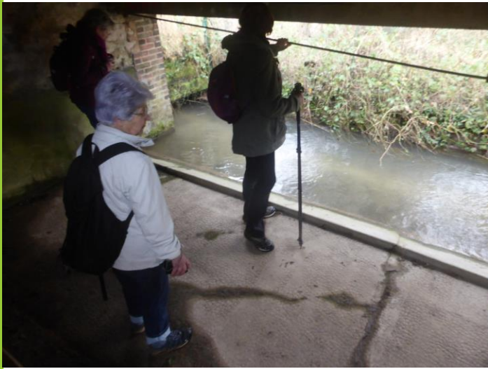
Le lavoir place du Nord (2) Il y a 7 lavoirs à Venizy.