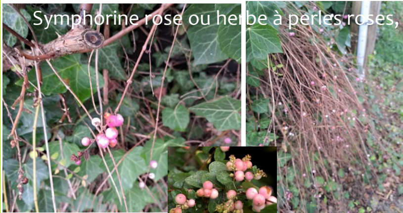
Symphoricarpos rose ou herbe à perles roses, arbuste caduque