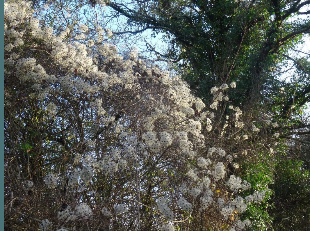
Gui, clématite sauvage et pervenche en fleurs