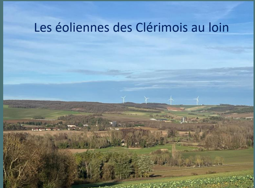
Les éoliennes des Clérimois au loin