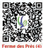
Ferme des Prés (4)